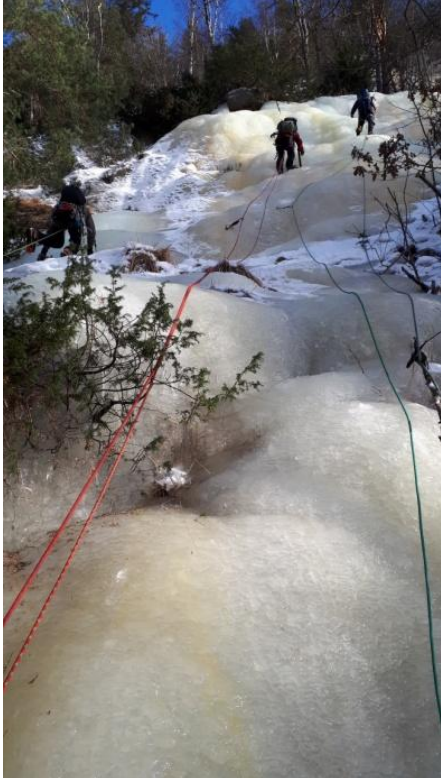
1.tl WI 2-3 ca50m opp til ett tre under sektor 3. Førstebestiger Lars Wegge og Einar Morland 2012.